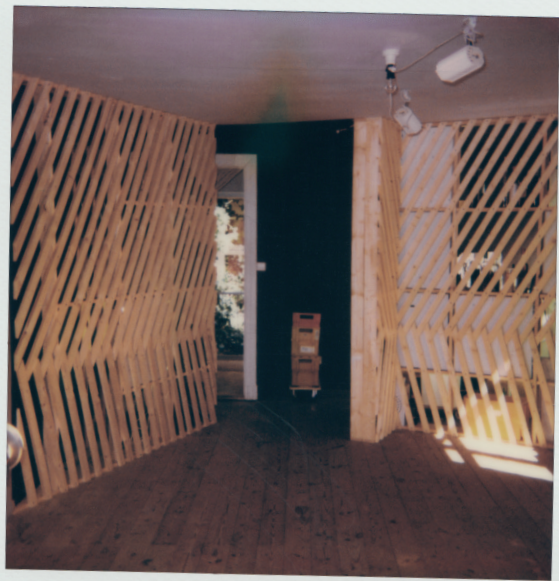
Umbau seit 2017