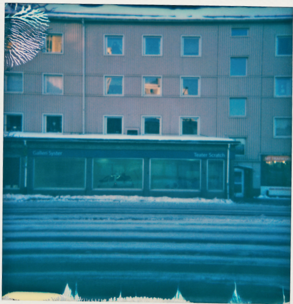
Vorort seit 2017